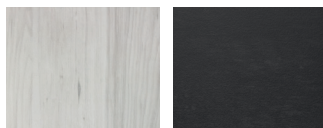
Alumi ljus trä Alumi svart